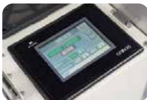
見やすいタッチパネル