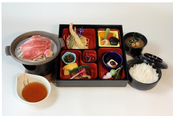
▲峰道レストランのお食事