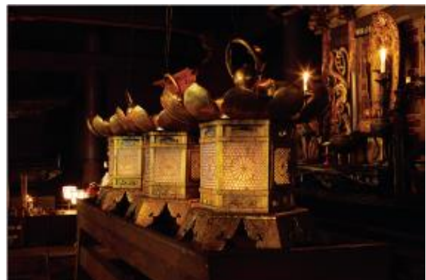
▲1200年灯り続ける不滅の法灯