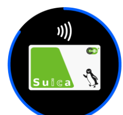
左から VO2 Max、パフォーマンスコンディション、トレーニング効果、フルカラーマップ、Suica