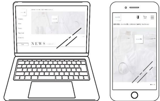
▲PC版・スマホ版イメージ