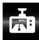
ドライブレ コーダー