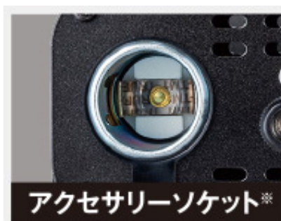
アクセサリソケット※