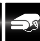
電気 ブランケット