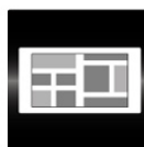
セーフティ レーダー