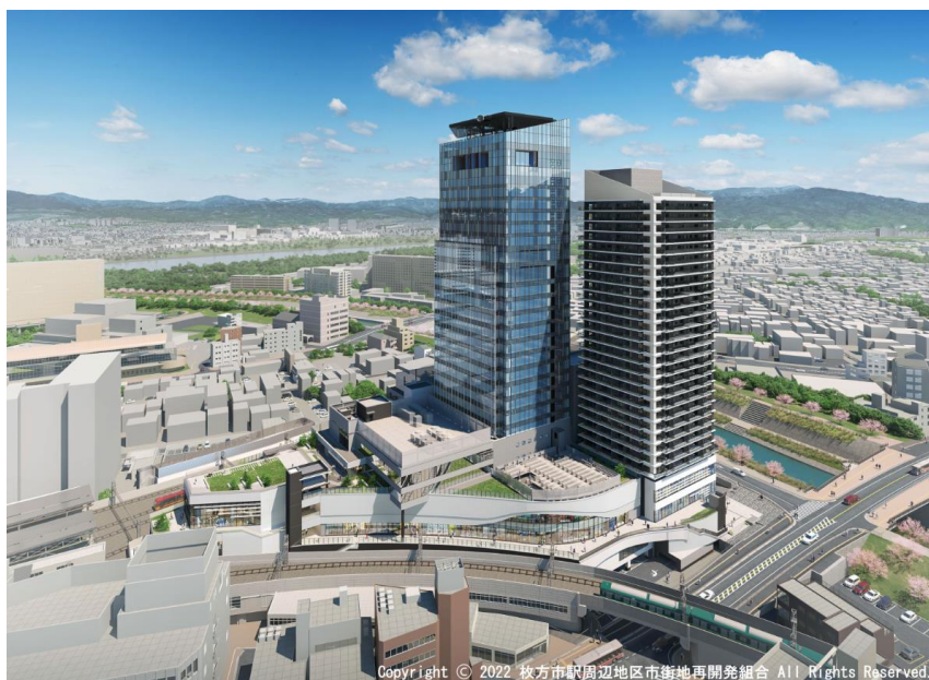
第3工区 完成イメージ(現時点の案であり詳細は今後の設計により決定します)