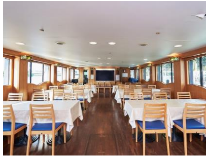
大型モニターもある船内