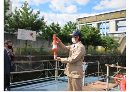
船上デッキでの現地調査の様子