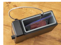
調理イメージ *調理中はフタをします。