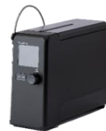
芯温スマートクッカー TLC70A

この度、購入ができなかった方々から、追加販売を望む声や製品に関するお問い合わせを多数いただいている状況を踏まえて、リターンを追加することを決定しました。今後、支援者の皆さまに早く製品をお届けできるよう、生産体制の構築に努めてまいります。