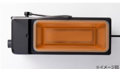
本体庫内の加熱イメージ

水に浸さず、チャック付きポリ袋※2に入った食材を庫内に入れて、庫内を加熱して食材を包み込むように加熱調理します。鍋や水の用意や、面倒な後片付けは不要です。※3