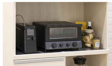
芯温スマートクッカー TLC70Aの設置イメージ

耐熱温度100℃以上の食品用チャック付きポリ袋が使用できます。調理後はジップロック®に入った食材を取り出すだけで手間がかかりません。