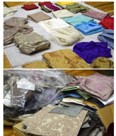
ナショナルインテリアがプロジェクトに提供したカーテンのサンプル