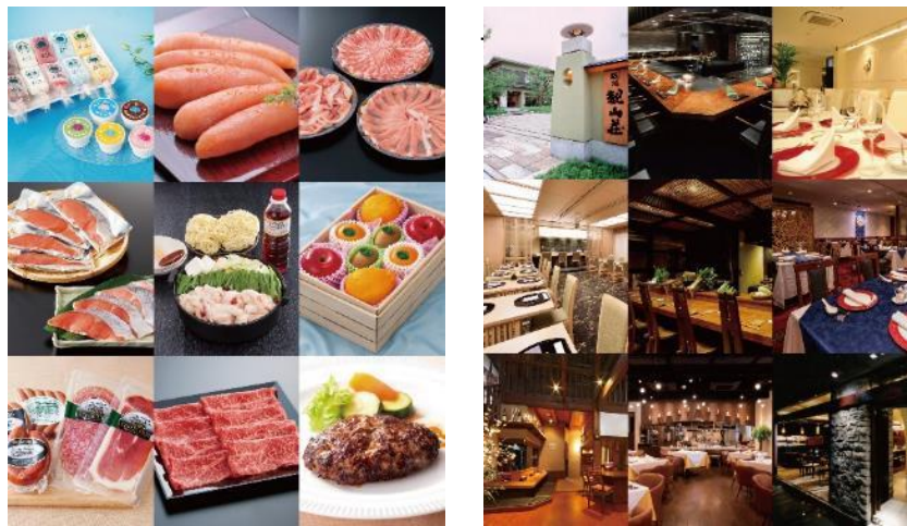
左：美味選集Aコース（30種類）／右：美味選集Hコース グルメチケット（25種類）2枚入

株式会社日比谷花壇（本社：東京都港区、代表取締役社長：宮嶋浩彰）と、日比谷花壇グループでプロモーション事業等を行う、株式会社イノベーションパートナーズ（本社：東京都港区、代表取締役社長：本田晋一郎）は、母の日のプレゼントや過ごし方を紹介する情報提供ポータルサイト「母の日コム」( https://hahanohi.com/ )にて株式会社岩田屋三越（代表取締役社長執行役員：伊倉 秀彦、以下岩田屋本店）が岩田屋三越オンラインストア「Precious Gift」で展開する、岩田屋オリジナルの選べるギフト「美味選集」の魅力をご紹介する記事を公開いたしました。