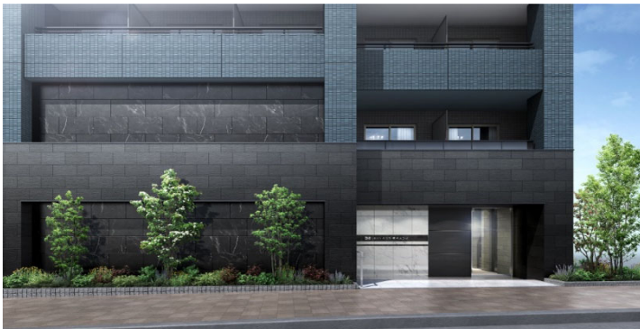
【エントランスイメージ】