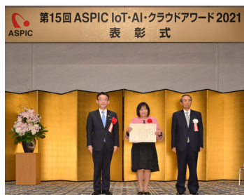
アワード2021(第15回) 中西祐介 総務副大臣より授与