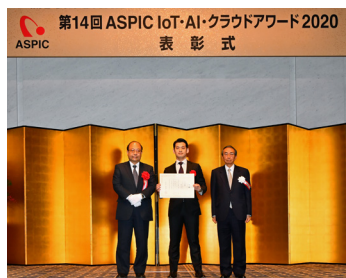
アワード2020(第14回) 谷脇康彦 総務審議官より授与