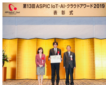
アワード2019(第13回) 木村弥生総務大臣政務官より授与