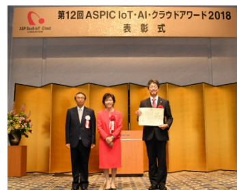
アワード2018(第12回) 佐藤ゆかり総務副大臣より授与