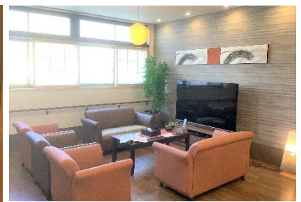
高崎ケアセンターそよ風(左)浴室、(中)ショートステイ居室一例、(右)ショートステイ共有スペース