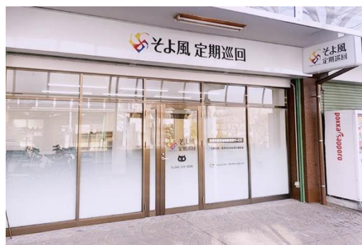
「そよ風定期巡回 たま」外観

https://www.unimat-rc.co.jp/shisetsu-zaitaku/134605