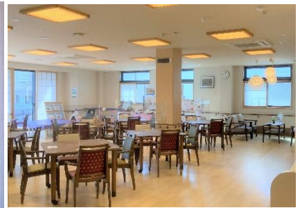
高崎ケアセンターそよ風(左)外観、(中)玄関ホール、(右)食堂兼機能訓練室