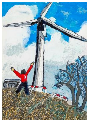
【絹谷幸二キッズ賞 グランプリ】