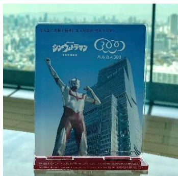
【アクリルスタンド（イメージ）】