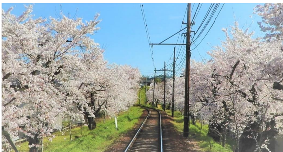
嵐電北野線 鳴滝～宇多野間のソメイヨシノの並木（2022年4月6日（水）午前9時頃撮影）

なお、嵐電北野線鳴滝～宇多野間の桜並木、通称「桜のトンネル」のソメイヨシノは満開を迎えています。