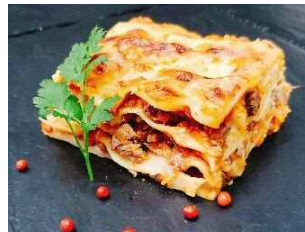
自家製ソースのラザニア 100g当り 388円 (税込420円)