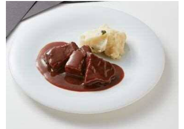
＜明治屋ストア推奨品＞ 【アール・エフ・ワン】 牛ほほ肉の赤ワイン煮込み ポテトピュレ添え(冷凍) 220g 1,800円 (税込1,944円)