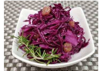
紫キャベツのマリネ 100g当り 380円 (税込411円)