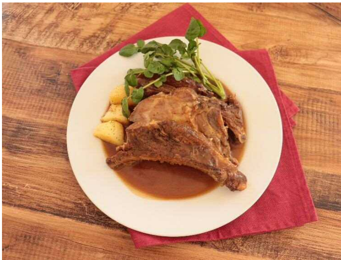
やまと豚スペアリブのビール煮込み 100g当り 689円 (税込745円)

店内製造の素材と明治屋独自のレシピにこだわったハンバーグ、ローストビーフなどの洋惣菜からサラダ、和惣菜まで、素材の味わいを生かした本物の味です。加えて、近隣のオフィスワーカーやお住まいの方にお楽しみいただける弁当類も充実をいたします。