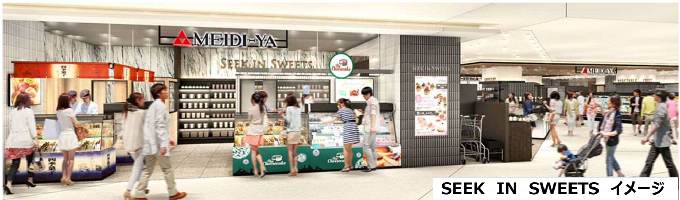
SEEK IN SWEETS イメージ