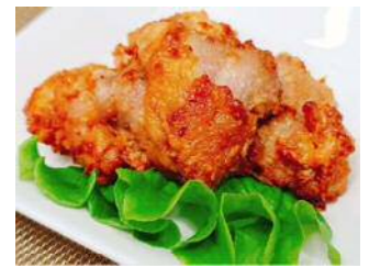
南部どりの唐揚げ 100g当り 345円 (税込373円)