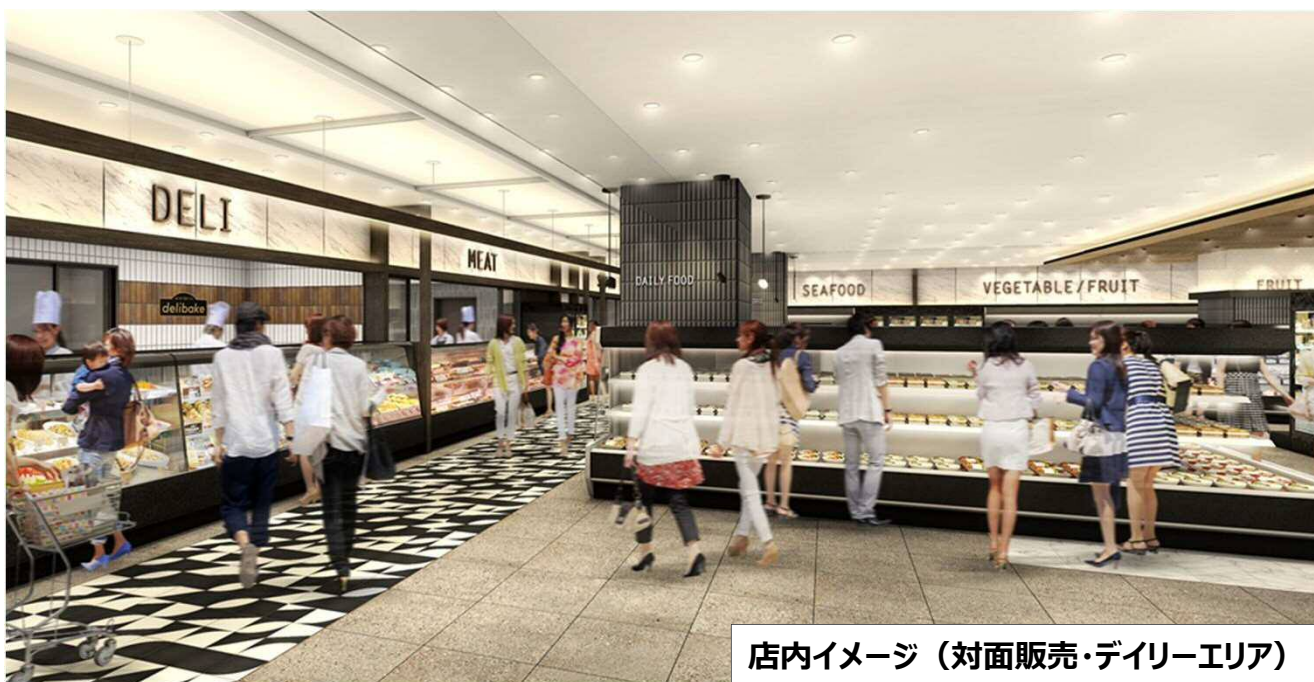
店内イメージ（対面販売・デリーエリア）