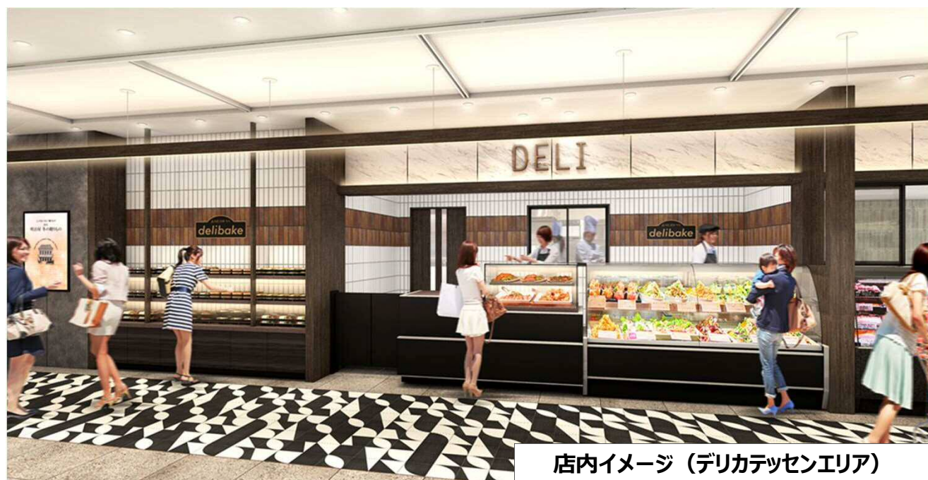
店内イメージ（デリカテッセンエリア）