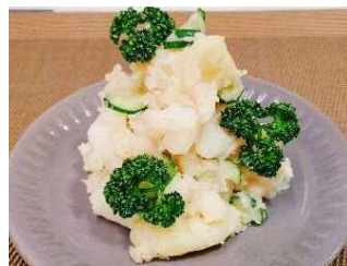
ドイツグランマのポテトサラダ 100g当り 270円 (税込292円)