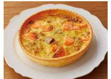
＜明治屋ストア推奨品＞ 【アール・エフ・ワン】 ゴルゴンゾーラ香るサーモントラウトのキッシュ(冷凍) 165g 1,100円 (税込1,188円)