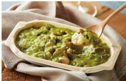
＜明治屋ストア推奨品＞ 【アール・エフ・ワン】 4種きのこと牡蠣のリゾット(冷凍) 240g 1,100円 (税込1,188円)