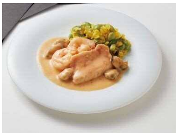
＜明治屋ストア推奨品＞ 【アール・エフ・ワン】 金目鯛と海老のマリエール サフランライス添え(冷凍) 200g 1,600円 (税込1,728円)