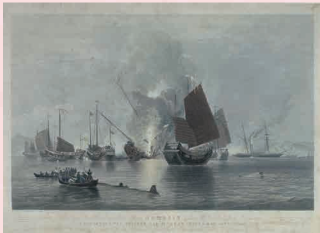
「アヘン戦争図」(4/23~5/22展示)

世界の歴史をたどる貴重書の数々! 東洋文庫が収集しているのは、かつての東洋、そして世界の姿を遺した貴重な記録たちです。それらを紐解くことで、私たちは歴史の名場面を追体験することができます。誰もが一度は耳にしたことのある書物の“本物”をご覧ください!