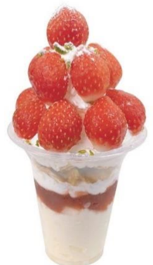
いちごパフェ※イメージ