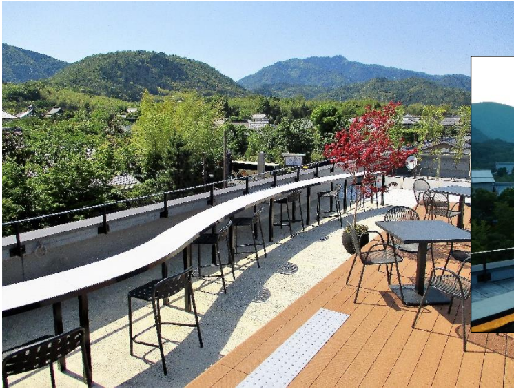
嵐山駅屋上エリア(正面は小倉山、右手は愛宕山)