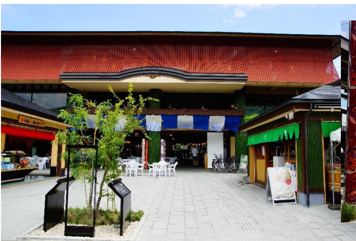
嵐山駅はんなり・ほっこりスクエア