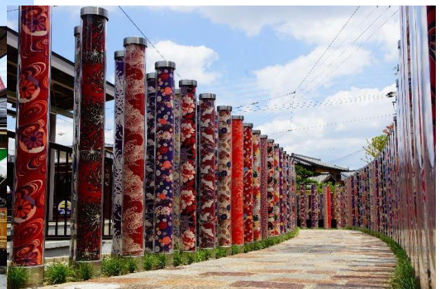
キモノフォレスト