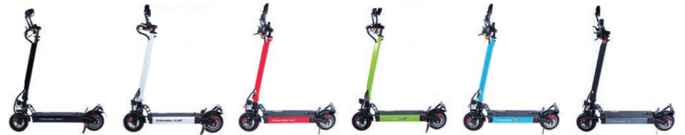
・アーバンブラック ・シルクホワイト ・カーマインレッド ・カントリーグリーン ・マリンプール ・モダングレー

簡易脱着式の大容量 10Ah バッテリーを標準装備。オプション品の 20Ah バッテリーを装着すれば最大約 70km の長距離走行が可能です。