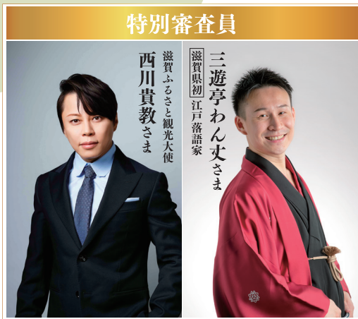
滋賀ふるさと観光大使 西川貴教さま