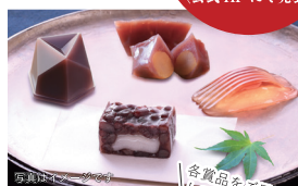
各賞品をご用意しております！