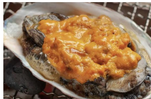
黒鮑にウニをたっぷりのせた「海里焼き」

同プランでは、赤ウニを贅沢に会席料理で堪能できる宿泊プランをご用意しました。また、宿の名物料理の「海里焼き」は、天然黒鮑にウニをのせて目の前で焼き上げる贅沢な料理で、こちらも期間限定の逸品です。