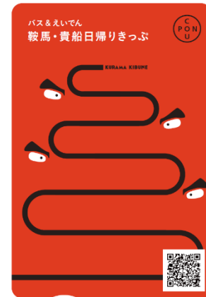
(1) 叡山電車1日乗車券「ええきっぷ」 (2) 京都洛北・森と水のきっぷ (3) バス&えいでん鞍馬・貴船日帰りきっぷ