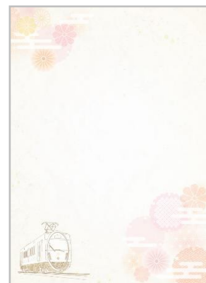
特別台紙デザイン

新型コロナウイルスの感染拡大状況により、内容を変更する場合がございます。その際は、随時、叡山電車公式ホームページおよび叡山電車公式Twitterにてご案内いたします。