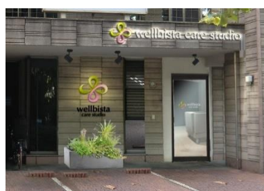
ウェルビスタ ケアスタジオ 成城(イメージ)

介護保険サービスと保険外個別リハビリサービスを同時一体的に提供することで生まれる相乗効果で、より早い機能回復と社会復帰が期待できます。