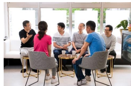
「ウェルビスタ ケアスタジオ」カフェスペースイメージ

2. 精神的サポート :スタジオ内には互いの悩みの共有や情報交換など自然なコミュニティの場所として自由にお使いいただけるカフェスペースを設けています。同じ境遇や目標をもった仲間がいるからこそ、ストイックに取り組むだけではない、前向きに継続できるモチベーションや向上心などが生まれます。