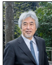
山極 壽一 総合地球環境学 研究所 所長