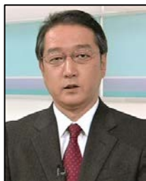
二宮 徹 NHK 解説委員室 解説主幹