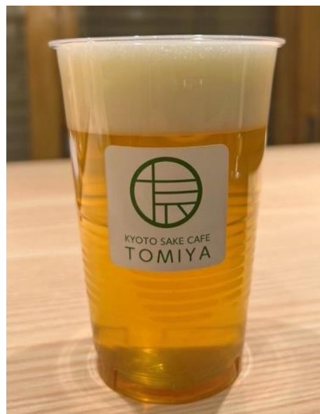
商品イメージ(上:京都醸造生ビール「一期一会」、左:バニラアイス日本酒かけ)