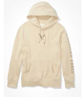
AE スーパーソフト グラフィック フーディ ¥ 7,700 (税込)