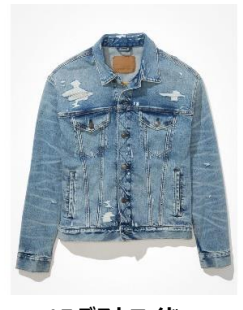
AE デストロイド デニム ジャケット ¥ 12,400 (税込)