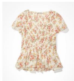
AE Vネックスモック ヘビードールブラウス ¥ 6,100 (税込)