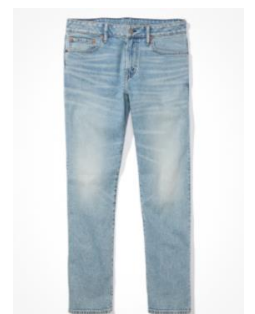
AE Flex オリジナル ストレートジーンズ ¥ 10,900 (税込)