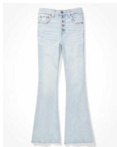
AE Ne(x)t Level スーパー ハイウエストフレア ジーンズ ¥14,000 (税込)