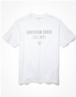
AE スーパーソフト グラフィックTシャツ ¥ 3,000 (税込)