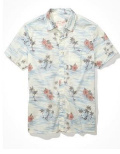
AE ショートスリーブ ボタンアップシャツ ¥ 6,900 (税込)