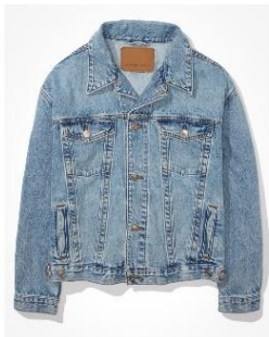
AE '90s ボーイフレンド デニム ジャケット ¥ 12,400 (税込)