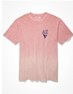
AE スーパーソフト グラフィックTシャツ ¥ 3,000 (税込)