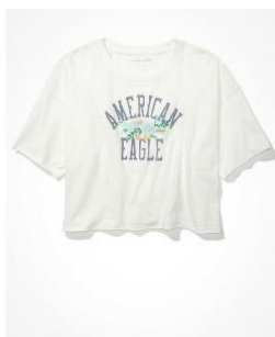
AE クロップド グラフィックTシャツ ¥ 3,800 (税込)