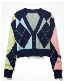
AE クロップドアーガイル ボタンアップ カーディガン ¥ 7,700 (税込)