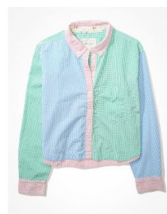
AE クラブハウス クロップド シャツ ¥ 6,900 (税込)