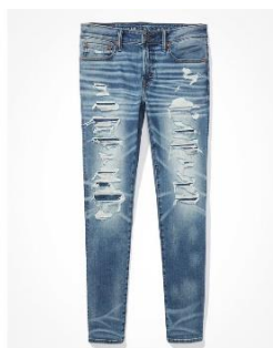
AE AirFlex 360 パッチ スキニー ジーンズ ¥ 17,200 (税込)