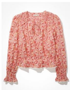
AE ロングスリーブ スモックブラウス ¥ 7,700 (税込)