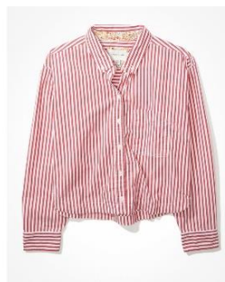
AE クラブハウス クロップド シャツ ¥ 6,900 (税込)