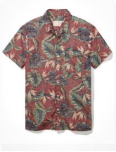
AE ショートスリーブ ボタンアップシャツ ¥ 6,900 (税込)