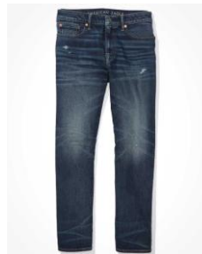
AE AirFlex+ リラクストレーツジーンズ ¥ 14,000 (税込)