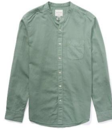
AE エブリデイ シャツ ¥ 6,900 (税込)