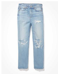
AE 超ハイウエスト '90s ボーイフレンドジーンズ ¥14,000 (税込)