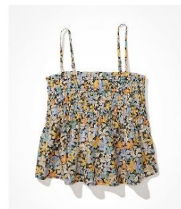
AE ケープトップ キャミソール ¥ 5,400 (税込)