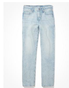
AE '90s ストレート ジーンズ ¥ 12,400 (税込)