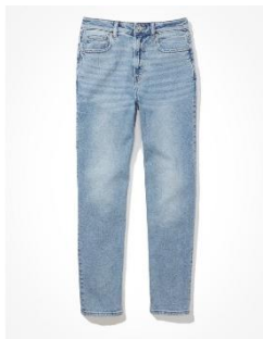
AE ストレッチ マム ストレート ジーンズ ¥ 12,400 (税込)