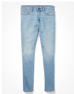
AE エアフレックス+ テンブ テック アスレチック スキニー ジーンズ ¥ 14,000 (税込)