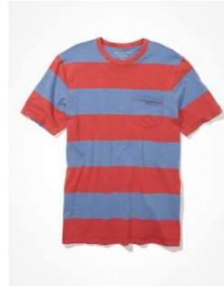
AE ヴィンテージ スラブ ポケット Tシャツ ¥ 3,000 (税込)