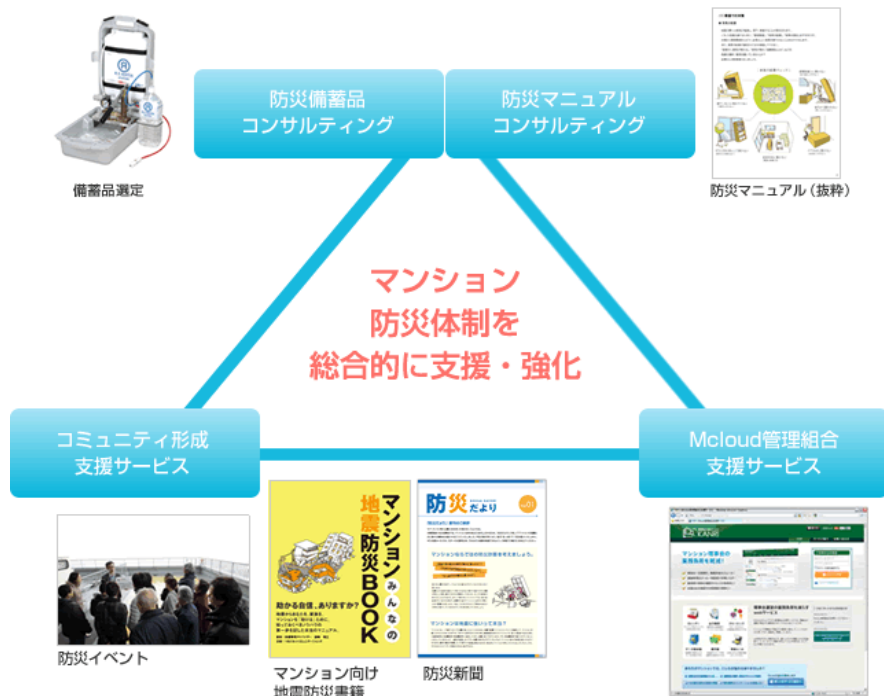
マンション向け防災支援サービスの全体イメージ