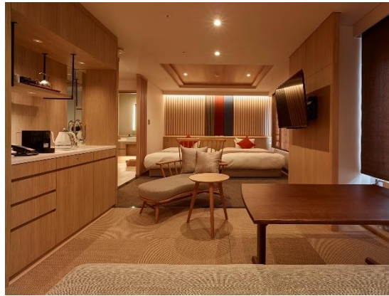
10階プレミアムフロア客室