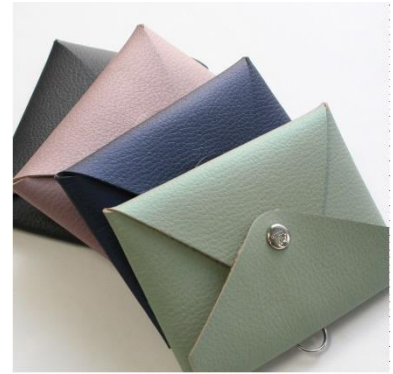
光沢感があり、経年劣化しにくい 人工皮革を使用

おもて面は中身が見える透明窓がついています。ホック付きで、大切なカードの落下を防ぎます。うら面は名刺20枚程度を収納することができる名刺入れになっています。本体重量は約17gと超軽量構造になっており、名刺を入れても重さが気になりません。肩こりを少しでも和らげたいという方にもおすすめです。また、ネックストラップを付ける金具は必要に応じて隠せるようになっていますので、机上に置いて商談も可能です。（意匠登録出願中）