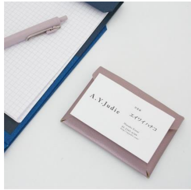
机上に置いて商談も OK