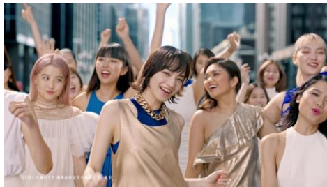
「サンデュアルケア技術」篇 (30秒)