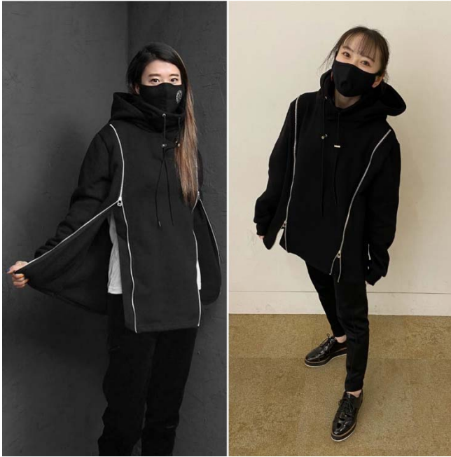
ジップの開閉アレンジで女子は可愛く