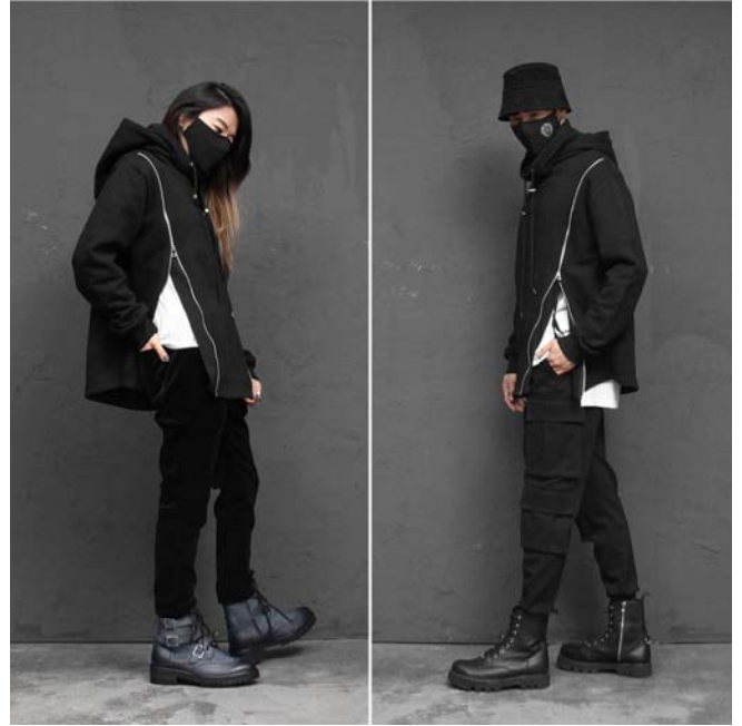
ジップアップで美脚シルエットに