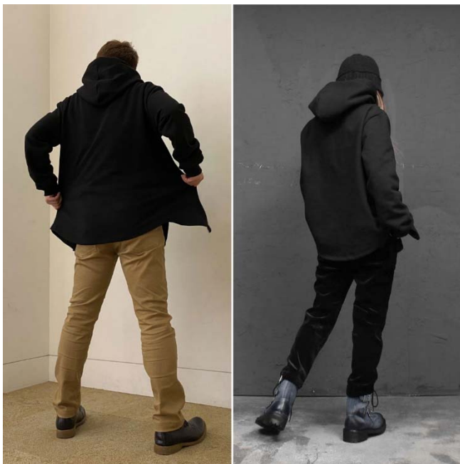
裾が流線形なので、バックシルエットも綺麗