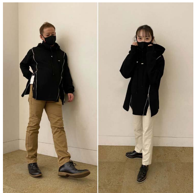
色んなカラーのボトムにも合わせやすい