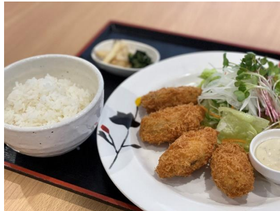
「広島県産カキフライ定食」

※スループレイや早朝・薄暮プランなどを除くラウンドプランにはご昼食券が付きます。(メニューにより追加料金が発生する場合があります。)