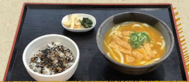
カレーうどん・そばと五穀とひじきのませごはん