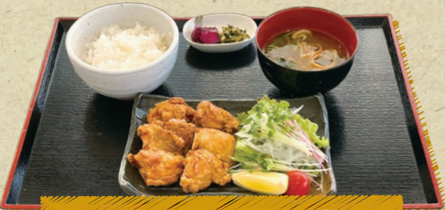
鶏もも1枚肉のから揚げ定食