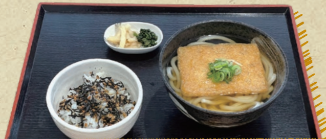
きつねうどん・そばと五穀とひじきのませごはん