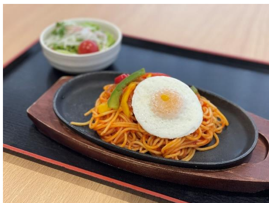
「目玉焼きのせ鉄板ナポリタン」

「ミックスフライ定食」や「鶏もも1枚肉のから揚げ定食」、「目玉焼きのせ鉄板ナポリタン」等の定番メニューに加えて、冬季の季節限定メニューとして「広島県産カキフライ定食」、「国産カキフライカレー」をご用意。詳細は別紙パンフレットをご覧ください。