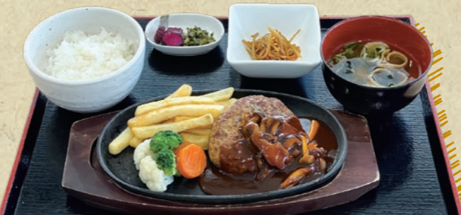
鉄板焼きハンバーグ きのこのソース