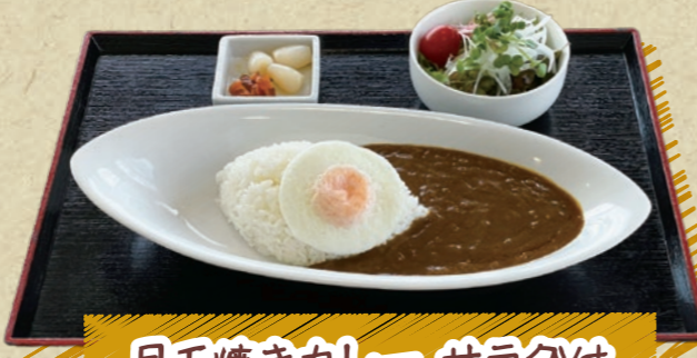
目玉焼きカレー サラダ付