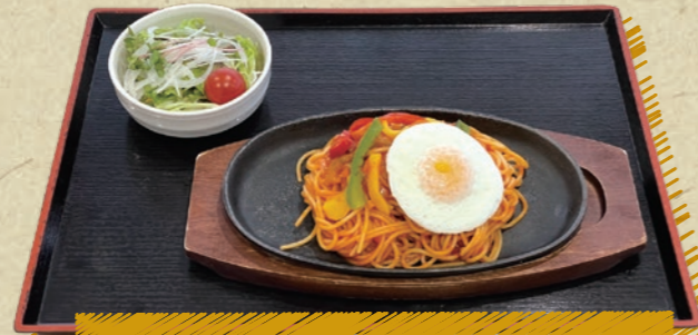
目玉焼きのせ鉄板ナポリタン