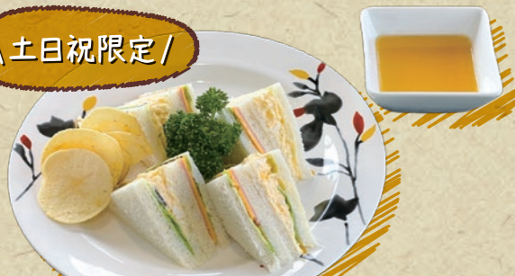
ミックスサンド ドリンクバー付き