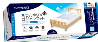
韓国でも展開中の「ひんやりジェルマット」