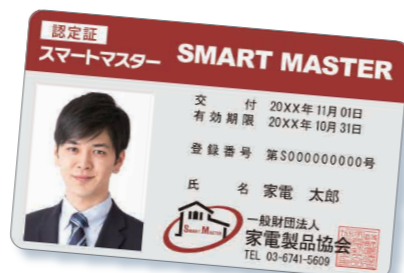
※カード写真はイメージです。

本資格制度では、『スマートマスター』を養成し認定するために、育成カリキュラムや学習テキストの提供、認定試験の実施、さらには資格取得後の継続学習の支援などが準備されています。一般財団法人 家電製品協会は、本資格制度を推進することを通して、IoT時代をリードし、かつスマートハウスが生み出す環境保護上および家庭生活上のメリットを広く社会に認知させることができる人材「スマートマスター」を育成してまいります。