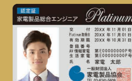
※カード写真はイメージです。