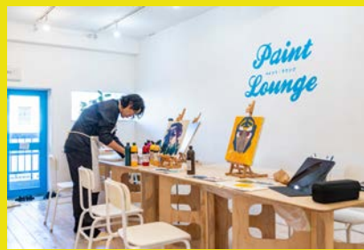
4点のキャンバスを並べ、乾く のを待ちながら描きました。