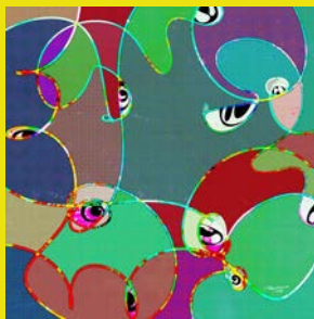
ムレルノモイイ。デモ、ソレヲ ミツケタラアナタハドウスル？ (A3 額入り)