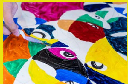
TAKUROM代表作 FRIENDS シリーズ、初の手描きに挑戦