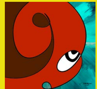
キメタナラ、 ツキススムシカナイ (A3 額入り)