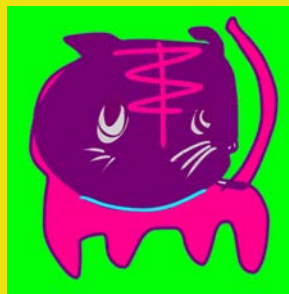
ジンセイイロイロ、 トラモイロイロ (A3 額入り)