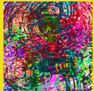
イツカハナハ、ウツクシクサク (606X606MM)