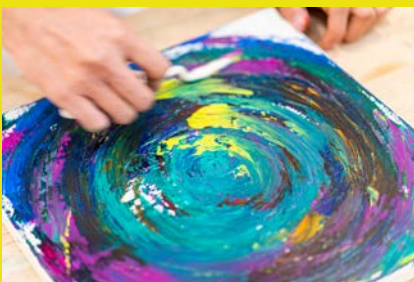
渦を巻くような心を 意識して描きました。

普段、デジタルツールを使用して作品を描いていますが、創作表現には本来ツールは重要ではないはずですが。自分自身、型にはまってしまっている気がして、新たな挑戦の思いも込めて初の手書き作品に挑戦しました。