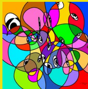
ヒトノメガキニナル (333X333MM)