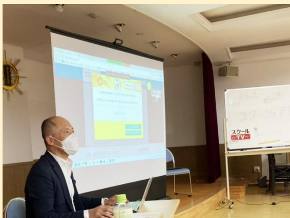
スクールTV Plusのレクチャー時の様子

ICT教育が開始する中、子どもたちにより良い学習環境を届けるべく2020年より三社で連携し、近畿・東海の合計6つの児童養護施設へ端末の寄付を行っています。しかし、依然として全国の施設で「デジタル機器の必要性を感じていても、実際に導入することは難しい」現状が続いています。また、小中高のプログラミング教育必修化に伴って、現在、小中学生の子どもたちが受験を迎える頃には受験科目に情報分野が追加されるなど、ICT教育環境はますます欠かせません。受験生になり焦りを感じる事の無いよう、日常から学校以外の場でもIT機器に接点を持ち「学習習慣」の定着に向け、今から環境整備とサポートが必要です。今後も全国の施設を対象に定期的・計画的に支援を広げる予定です。 “質の高い教育をみんなに”のSDGsの精神に則り、子ども達の学習環境の充実に向け三社で尽力して参ります。