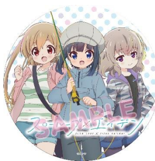
コラボヘッドマーク、ラッピングのイメージ