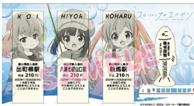
コラボきっぷのイメージ