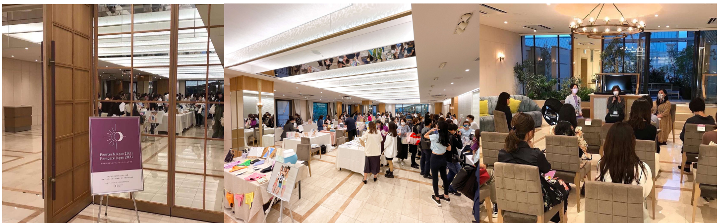
写真は2021年10月開催時の様子／左から入口、メイン会場、セミナー会場