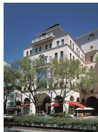
写真は「アニヴェルセル 表参道」の会場内および外観の様子

【出展者数】40～50社・団体程度(月経ケア、妊活・不妊・妊娠後・産後、女性特有疾患、更年期ケア、セクシャルウェルネス、メンタルヘルス等に関する企業・団体が出展予定)