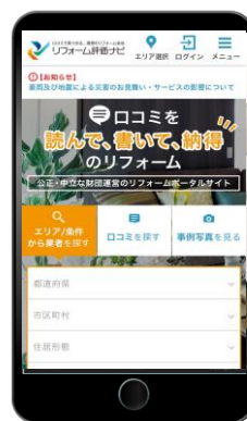
<TOPページ> (スマホサイト)