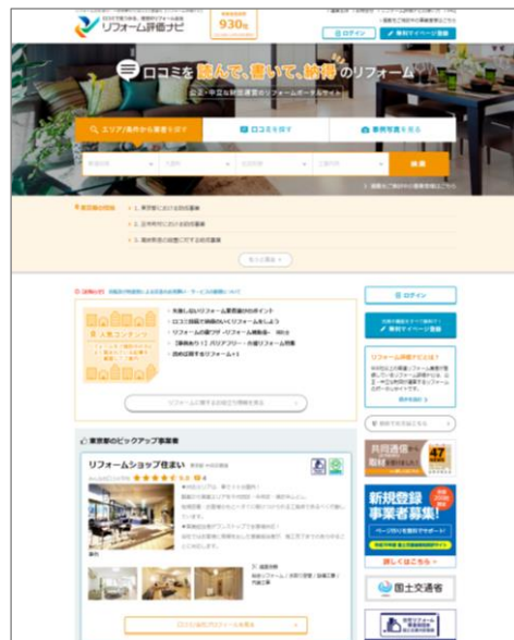
<TOPページ> (パソコンサイト)

サイトには、消費者が安心してリフォームができるよう、リフォーム事業者に関する情報だけでなく、リフォームの基礎知識や行政関連制度に関する情報も、わかりやすい動画も活用しながら豊富に掲載しています。