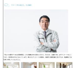
< 動画・取材ページのイメージ >