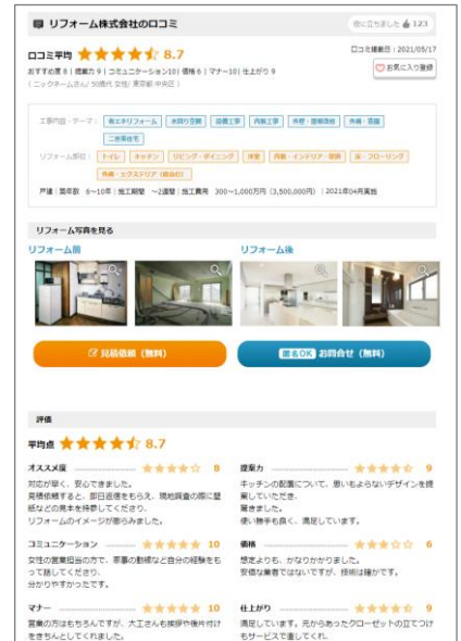
< 口コミページのイメージ >

希望する事業者に事務局が取材し、事業者ページに掲載します。第三者の視点から見た事業者の魅力や長を消費者に伝えます。