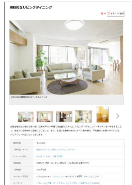
< リフォーム事例ページのイメージ >