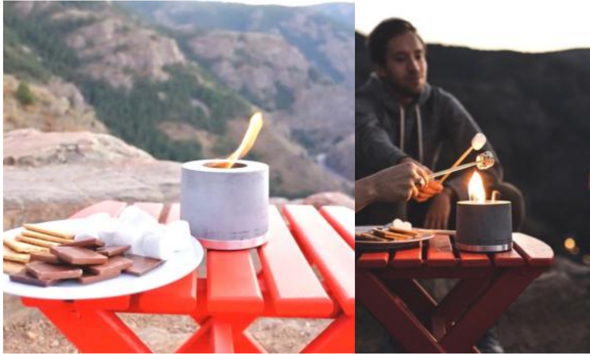
もちろんアウトドアでも・ミニキャンプファイヤー