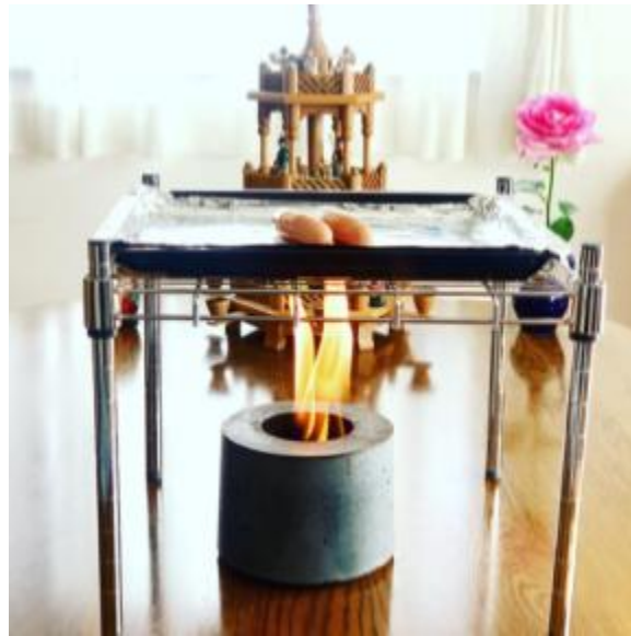
ラックを置けば防災用コンロにも

■フリッカーファイヤー(Flikrfire)は米国テネシー州のメーカーが開発した、特別に加工した耐熱コンクリートを使用しています。デザインは日本のワビサビを意識したシンプルなグレー。ベースのシルバー色が光り、和にも洋にも合います。