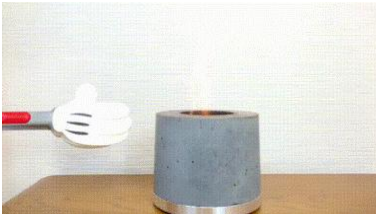
押しても揺らしても倒れない (クリックで GIF アニメが流れます)