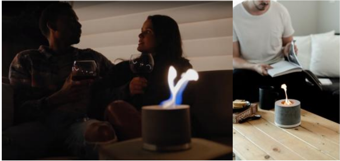
デートナイトや読書・在宅ワーク