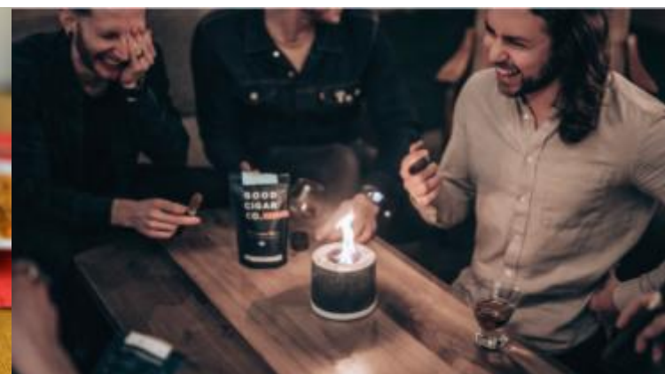
テーブルを飾ったり友人との楽しい時間