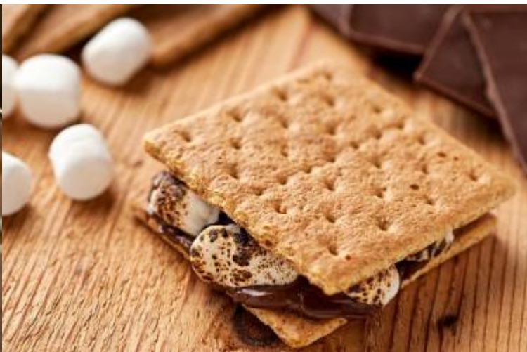
焼きマシュマロやスモアーズ