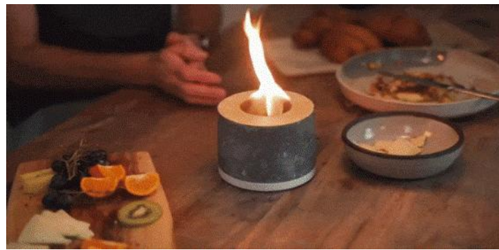
ファミリータイム (クリックで GIF アニメが流れます)