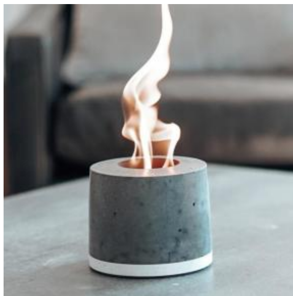
フリッカーファイヤー

■キャンドルでは物足りない、でも焚き火は準備と片付けが大変、という方におすすめです。