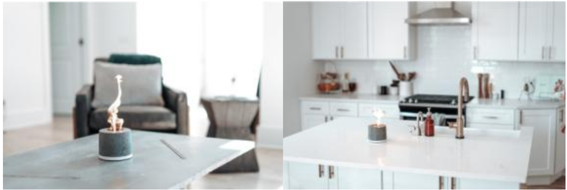
リラックスタイム・インテリア