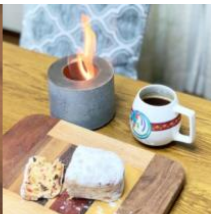
暖かい雰囲気やカフェタイムの演出