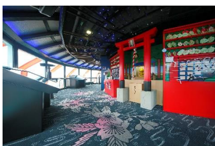
▲たわわちゃん神社

※「たわわちゃん絵馬」「たわみくじ」のご祈祷、お浄めは賀茂御祖神社(下鴨神社)さまに執り行っていただきます。