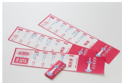
▲たわみくじ(たわわちゃんのおみくじ)