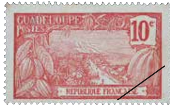
世界ではじめて画面にランが現れた切手（仏領グアドループ、1905年）

花やランが、いつどのように切手に現れ、現在のように多くの種類が発行されるようになったのか、その歴史をひもときます。