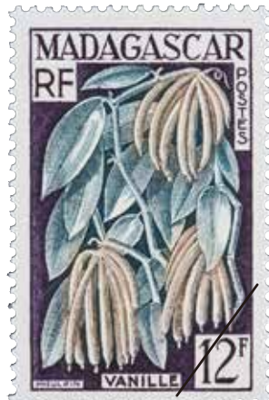
はじめてバニラを主題とした切手（仏領マダガスカル、1957年）

切手の印刷は、偽造防止の技術革新と共に発展してきました。ランの切手の多様化に印刷技術が果たした役割を解説します。