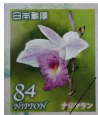
沖縄県西表島の天然記念物 「星立天然保護区及び仲間川天然保護区域」 切手シート中のナリヤラン Arundina graminifolia (2020年) 沖縄初の野生ランの切手