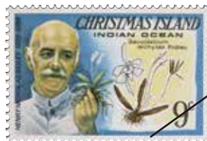
ラン研究者が描かれた切手（豪州領クリスマス島、1977年）

ランという植物の多様化の歴史を明らかにしてきた様々な研究と、それが切手の図柄にどう反映されてきたのかを紹介しします。