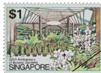
ラン産業の拠点となる植物園の記念切手（シンガポール、1979年）