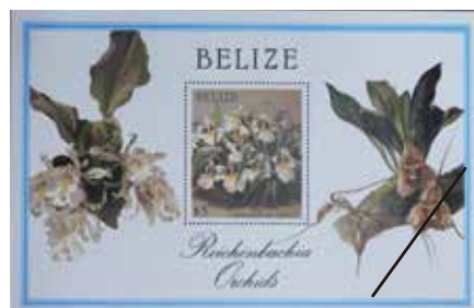
19世紀末のラン図譜「Reichenbachia」の図に 基づいて中米ベリーズで発行された切手シート(1987年) 中心のランは Miltoniopsis roezlii .