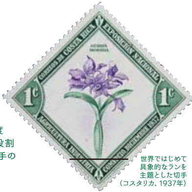
世界ではじめて具象的なランを主題とした切手（コスタリカ、1937年）

日本の郵政150周年にあたる今年、近代郵便制度とともに誕生した切手の役割と、日本や沖縄の郵便と切手の歴史をふりかえります。