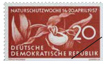
はじめてランが描かれた自然保護切手（東ドイツ、1957年）