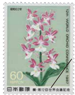
日本ではじめて具象的なランが描かれた切手（日本、1987年）