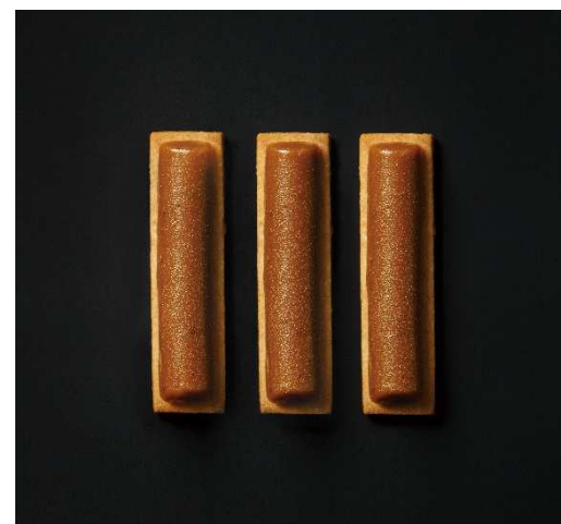
トパーズ（コーヒーカカオ）