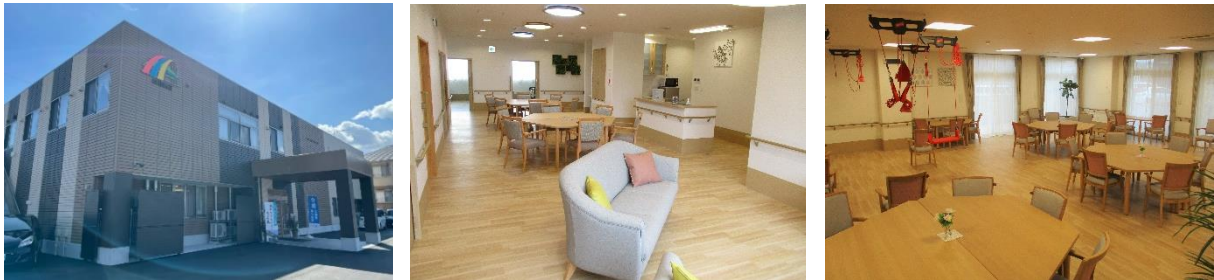
高知ケアセンターそよ風 (左)外見、(中)ショートステイ共有フロア、(右)デイサービスフロア

ショートステイ https://www.unimat-rc.co.jp/shisetsu-zaitaku/394503