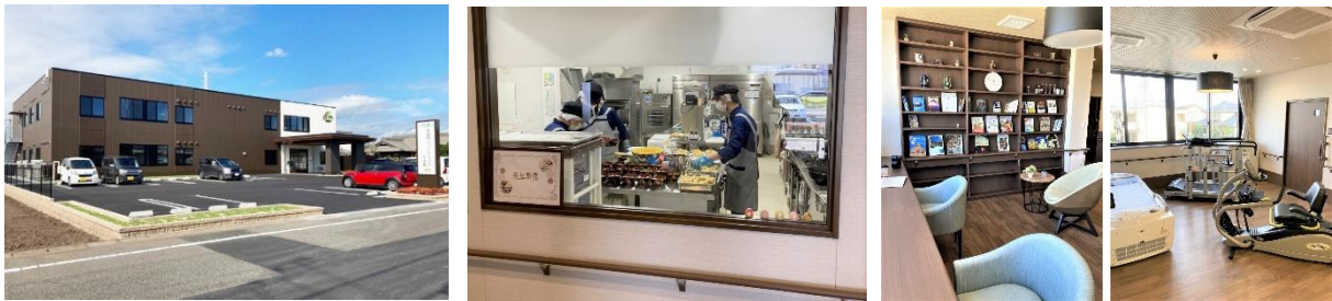
各務原ショートステイそよ風 (左)外観、(中)厨房前の通路に設けた窓、(右)カフェのような寛ぎ空間「けやき」と機能訓練を強化した「かえで」

<各務原ショートステイそよ風> https://www.unimat-rc.co.jp/shisetsu-zaitaku/214523