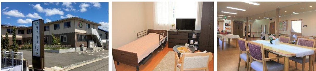
盛南ケアコミュニティそよ風(左)外観、(中)居室一例、(右)2階食堂

<盛南ケアコミュニティそよ風> https://www.unimat-rc.co.jp/shisetsu/218