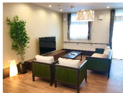
宇治グループホームそよ風(左)外観、(中)「いろは」共有スペース、(右)「やまぶき」共有スペース