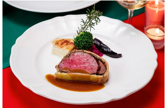
国産牛フィレ肉のウエリントン 温野菜添え マデラワインソース