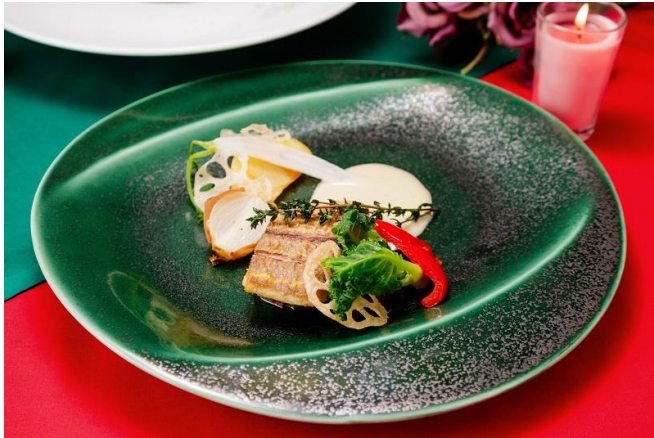
イトヨリ鯛のポワレ アンチョビクリームソース 柑橘の香り