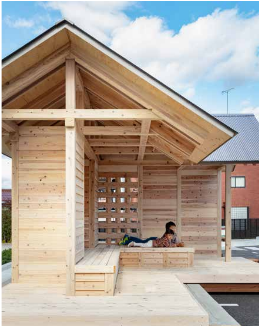
中に入る小屋から、ヒダ状の壁の周りにあつまれる小屋への転換。