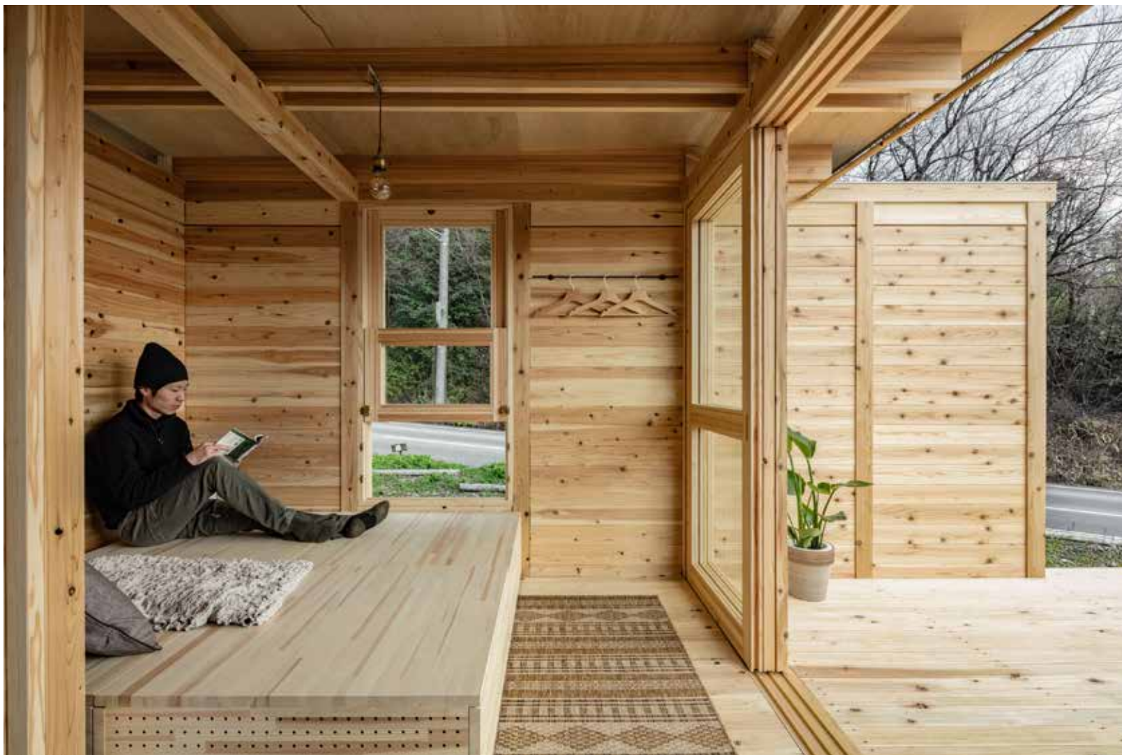
無垢材のログ壁面は、使い手によって容易にカスタマイズや修復が可能。さまざまに使える壁面。