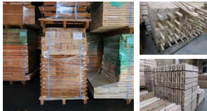
事前加工された部材がキットとして届けられ、家族での組立てが可能な製品。