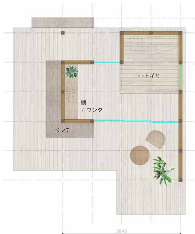
case-1 室内8㎡ + デッキ19㎡