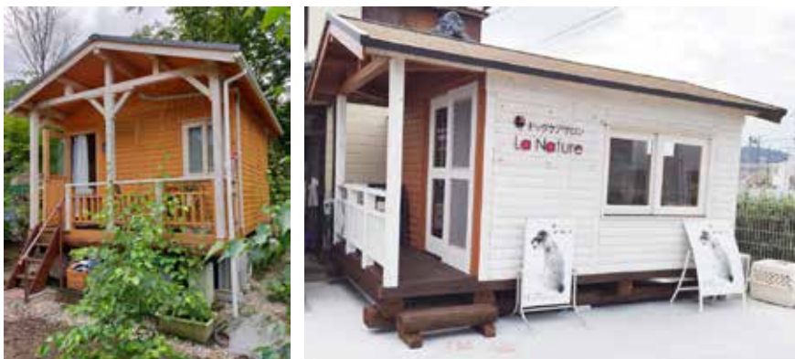
従来のキットハウス展開。書斎や倉庫、小型店舗などとして利用されてきた。