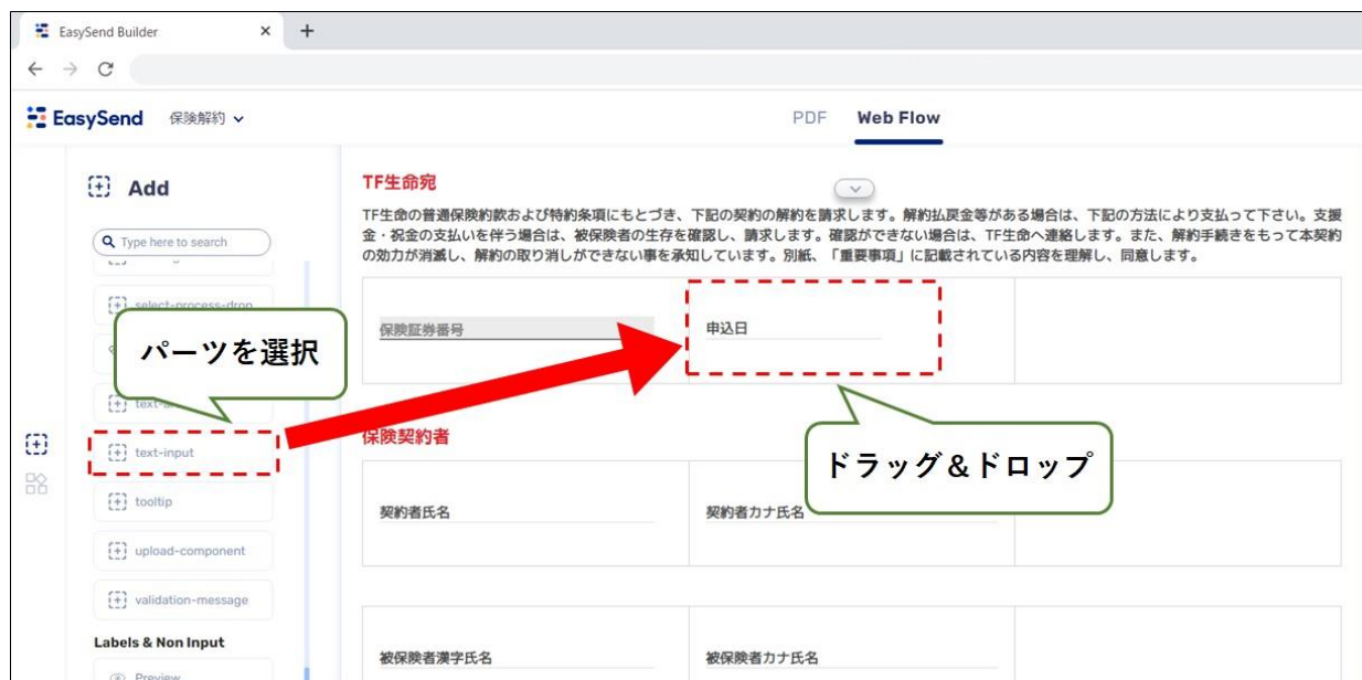
「EasySend」を利用した Web フォームの開発イメージ

「EasySend」は少ないプログラミングで簡単に Web フォームが開発できるノーコード/ローコードシステムです。ドラッグアンドドロップなどの簡単な操作だけで Web フォームを構築することもできる他、プログラミングにより機能拡張することも可能です。それに加え、本サービスでは、既存の紙の帳票の PDF データを取り込み簡単に Web フォームを作成する機能や、Web フォームへと入力した内容を帳票形式の PDF データとして出力する機能も備えています。保険業界などの申込書や請求書など数多くの帳票を取り扱う企業において本サービスをご利用いただくことでスピーディーな開発が可能であり、早期に Web フォームサービスを開始することができます。