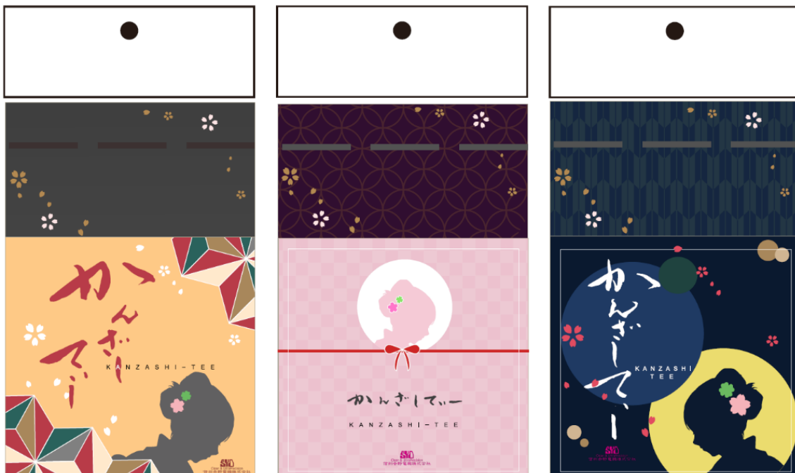
ノベルティーへ採用