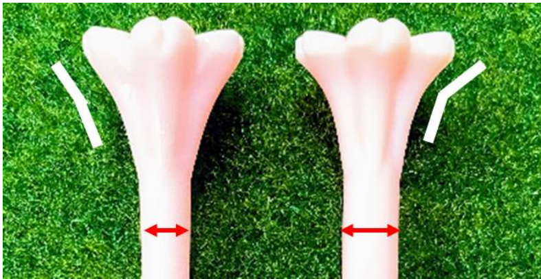
左 ショートティー クラウン鈍角 根本細め 右 ロングティー クラウンよりシャープに 根本太め

上記のネットで見つけて本商品開発のきっかけとなったゴルフティーを挿した女性は、偶然だが現在岡谷市（当社がある塩尻市隣）に在住されている プロゴルファー青山加織さん と分かった。2020年4月ショートティーの市販発売開始に合わせて青山プロを訪問したところ、「土に還るティー、形も可愛くて気に入った。ただしプロはロングティーしか使わない、奥まで挿せばショートティーにもなる。そもそもかんざしと言うならもっと長さを下さい、ロングティーなら私は使う！」と助言され、すぐ金型を改造しクラウン部分は青山プロの助言を反映させよりシャープにしてロングティーを開発、7月より発売開始した。