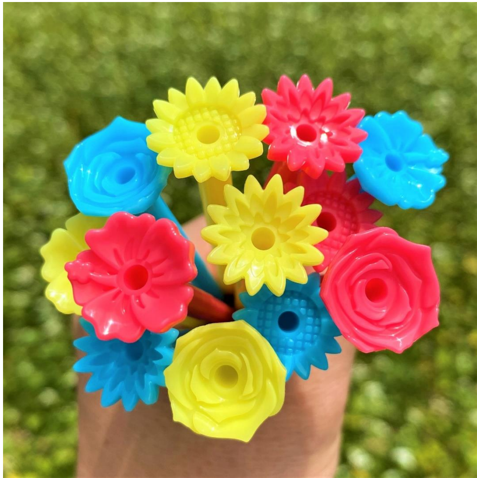
一般公募からできた新しい4つの花のゴルフティー ヒマワリ、バラ、ハイビスカス、ダリア