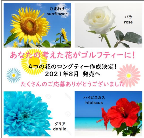
応募から4つの花を決定した