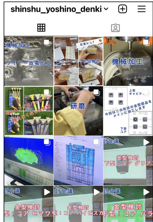
新商品開発の過程を随時公開しながら発売へ