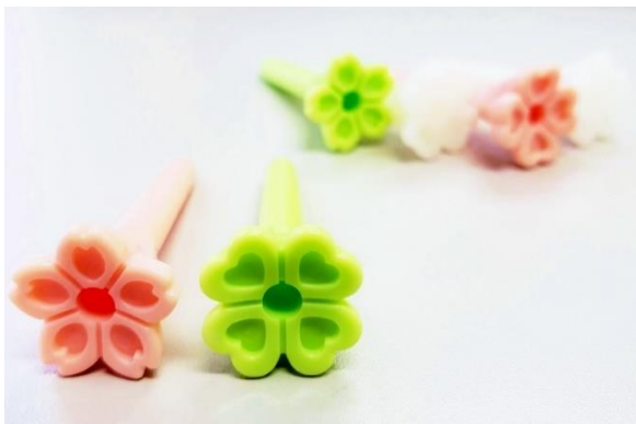
桜 四葉クローバー 2つの形状

https://news.golfdigest.co.jp/news/gdoeye/jlpga/article/51385/1/