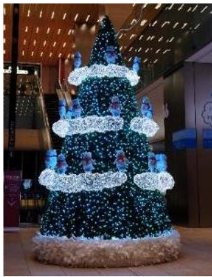
④17階オフィスロビー