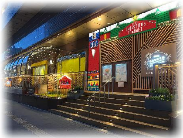
天王寺ミオ ミオ ガーデンテラス (11月1日(月)～12月25日(土) 予定)