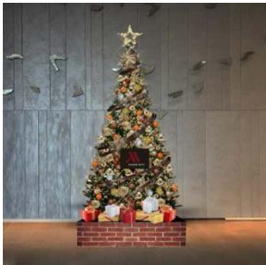
⑤大阪マリオット都ホテル 19階ロビー