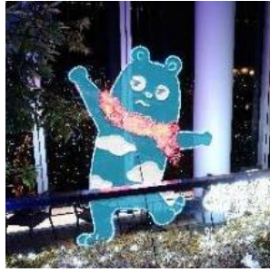
②ハルカス300（展望台） 58階天空庭園