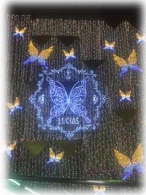
アポロピル・ルシアスピル