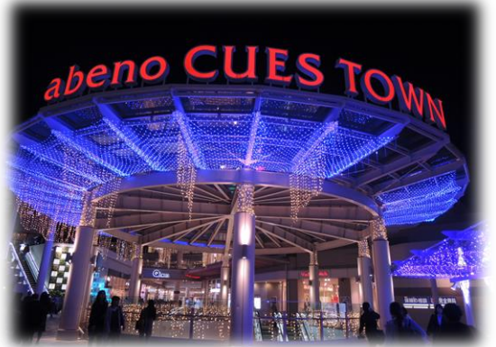
あべのキューズタウン