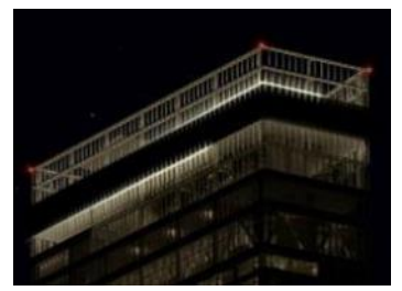
①トゥインクルライト